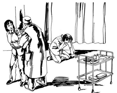
■ 中共酷刑示意图：对法轮功学员注射不明药物