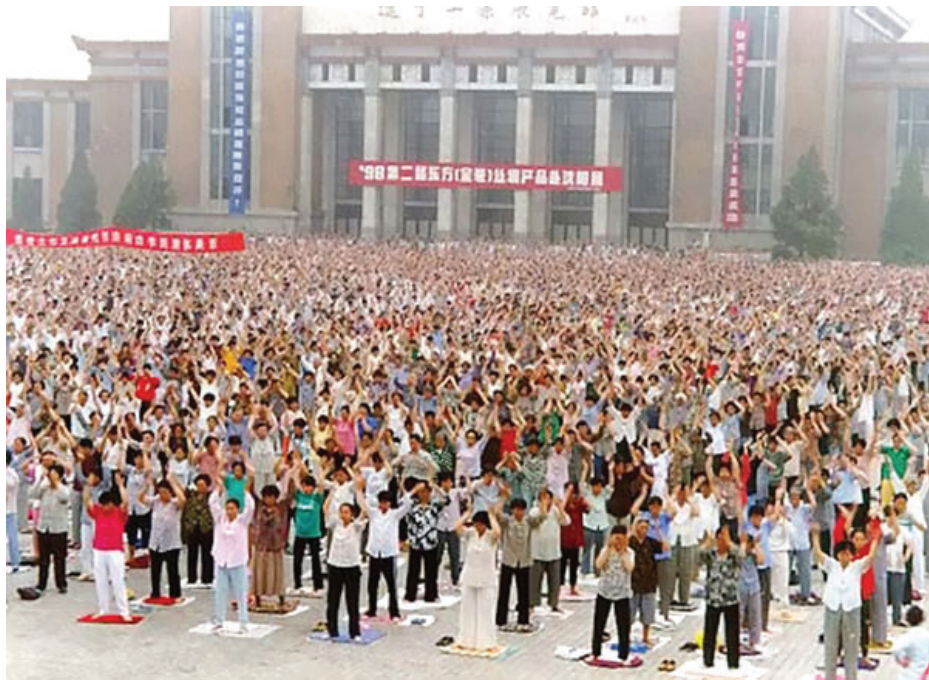
▲ 1998年5月沈阳市法轮功学员在炼功。

我吓了一跳，赶快到医院。医生检查后说肿块太小，无法确定是甲状腺瘤还是囊肿，但是边缘光滑，可以暂不做治疗，先观察着看看，如果发现肿块短时间内有增大趋势，再来医院就医。从此，这个肿块成了我的心病，时不时都要摸摸，好在几年下来都没怎么长大。