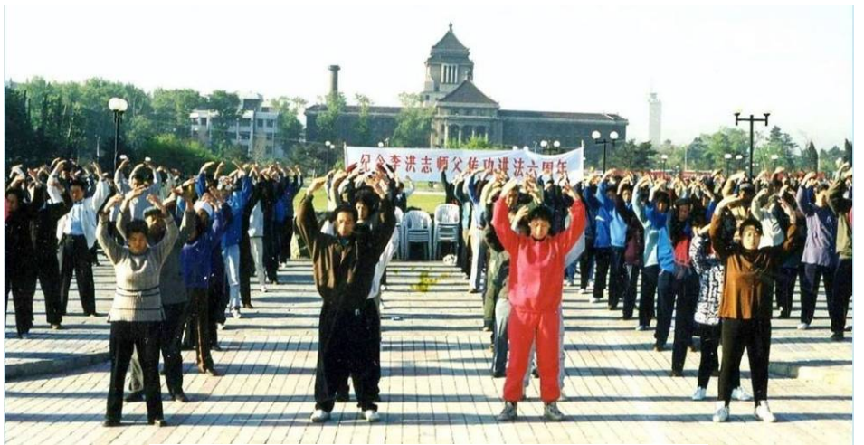
图：1998年长春法轮功学员集体炼功