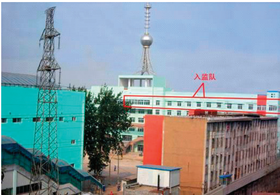
▲ 山东省监狱

以上是中国大陆的监狱对非法关押的法轮功学员迫害的冰山一角，因各种原因还有很多邪恶没有被揭露出来。只有早日解体中共，才能结束对法轮功的迫害。◇