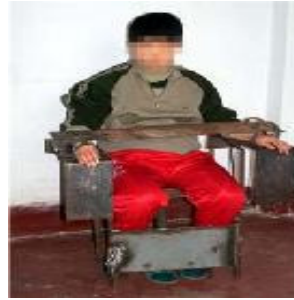
中共酷刑示意图：铁椅子