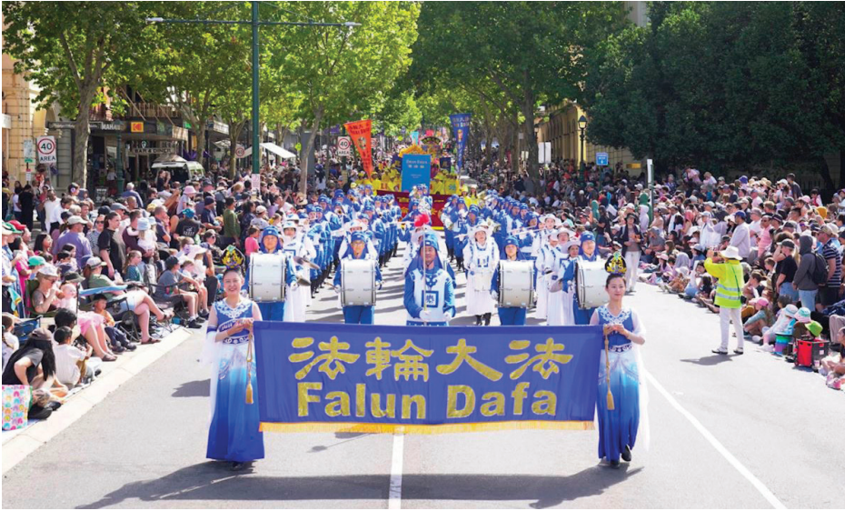
▲ 4月5日, 澳洲法轮大法学员参加了本迪戈复活节大游行。(明慧网)

【明慧网】2026年4月3日至6日, 澳洲著名的淘金镇本迪戈举行了一年一度的复活节庆典。复活节是庆祝耶稣基督从死亡中复活的全球性节日, 象征着重生和希望。庆祝活动包括乐队表演、焰火表演、寻找复活节彩蛋等。4月5日的复活节游行是最为盛大的活动, 吸引数万市民和游客现场观看。