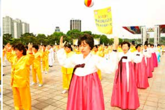
▲ 美国（左）、韩国（右）部分法轮功学员集体炼功。