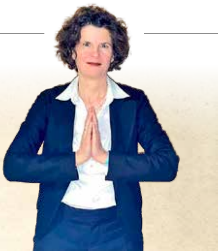
▲ 德国法轮功学员希尔克女士。