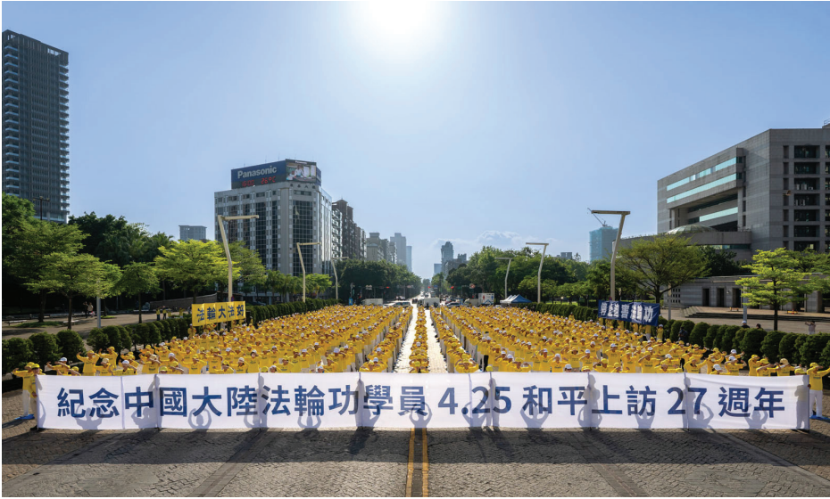
▲ 4月19日，法轮功学员在台北市府广场前集体炼功。

今年是法轮功学员“4·25 万人大上访”27周年，世界各地的法轮功学员都在以不同方式，纪念这个特别的日子。