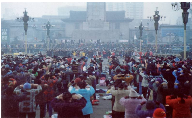
(1999年初南昌市“八一”广场清晨万人炼法轮功)

法，是以宇宙特性真、善、忍为根本指导，使修炼者返本归真的高层次修炼法门。修炼法轮功主要是学法（读法轮功书籍）、修心及炼功，生活中按照真、善、忍的标准要求自己，同时学炼五套功法，动作简单易学，法轮功学员义务教功。法轮大法至今已传播一百多个国家，上亿人通过修炼法轮功得到身心健康。