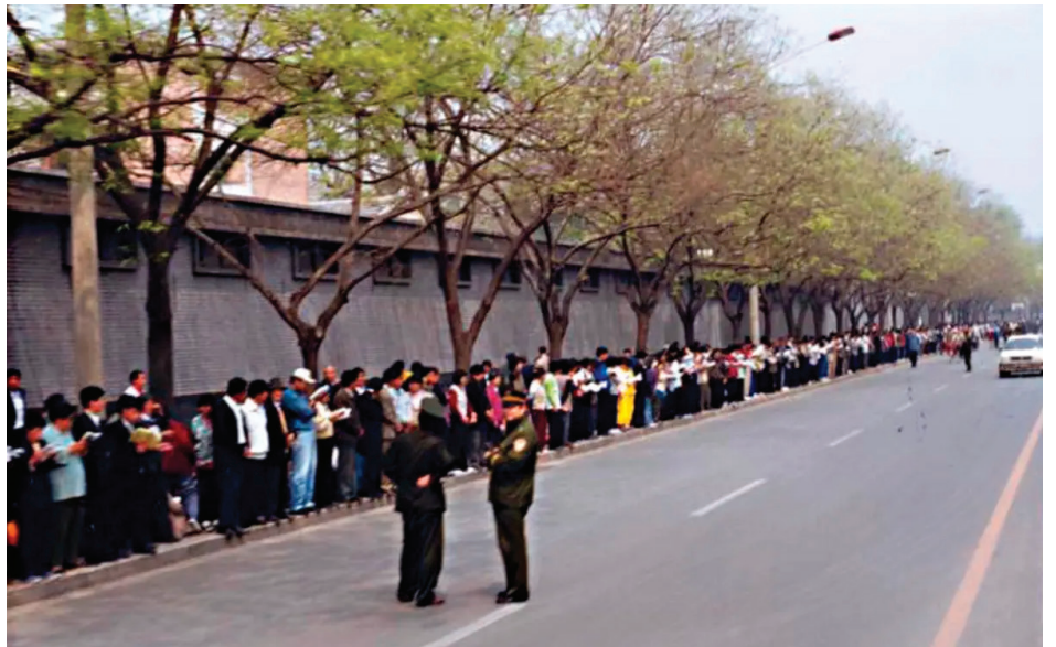
▲ 1999年4月25日，万名法轮功学员在北京信访办和平请愿。

其一，炼功点的口耳相传：当时全国几乎每十个人中就有一个人在学炼法轮功，各地都有晨炼的“炼功点”。天津事件发生后，相关的抓捕消息和“天津不让人，让去北京反映情况”的消息，通过辅导员（义工）或学员在早晨炼功