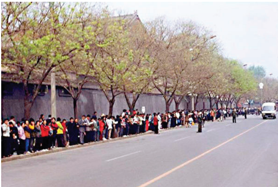
▲ 1999年4月25日，万名法轮功学员在北京信访办和平请愿。

25日大约上午8点左右，我们在长安街下了车，居然有警察引领我们来到了新华门的红墙之外，陆陆续续来的大法弟子们很有秩序地站好，在人行道上，规规矩矩地站在马路牙子以内，人群大约站了三四行。在这里，我看到了我的父母，他们和自己炼功点的几个同修站在一起。我们谁都不大声喧哗，（虽然扯开嗓门讲话，是我们大部份农村人的生活习惯），大家交流低声细语。有陌生的同修提醒：年轻人站在最前面，老年同修累了可以在后面坐坐，大家不要双手叉腰，也不要抱在胸前（有对抗的意思）……我们自觉把这些提醒扩散出去。