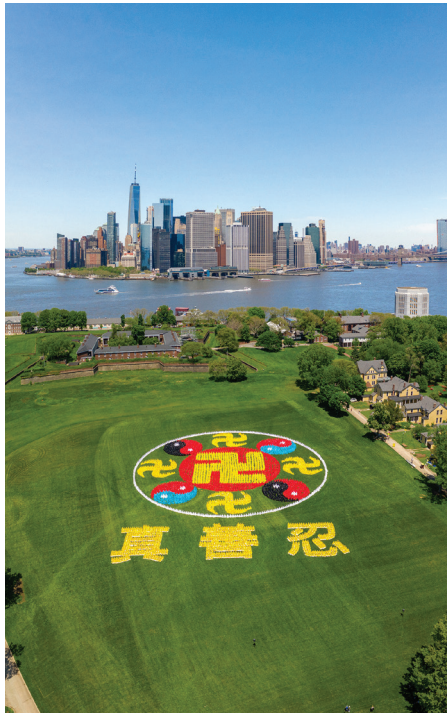
▲2019年5月18日，法轮功学员五千人在纽约总督岛公园排出法輪图形和“真善忍”三个字。

大约下午4、5点钟，新华门那里喧闹起来，能清晰地听到人们热情的招呼：朱总理！也听到了朱身边的工作人员说：“不能都聚在这里，派几个代表里边谈谈。”有人高