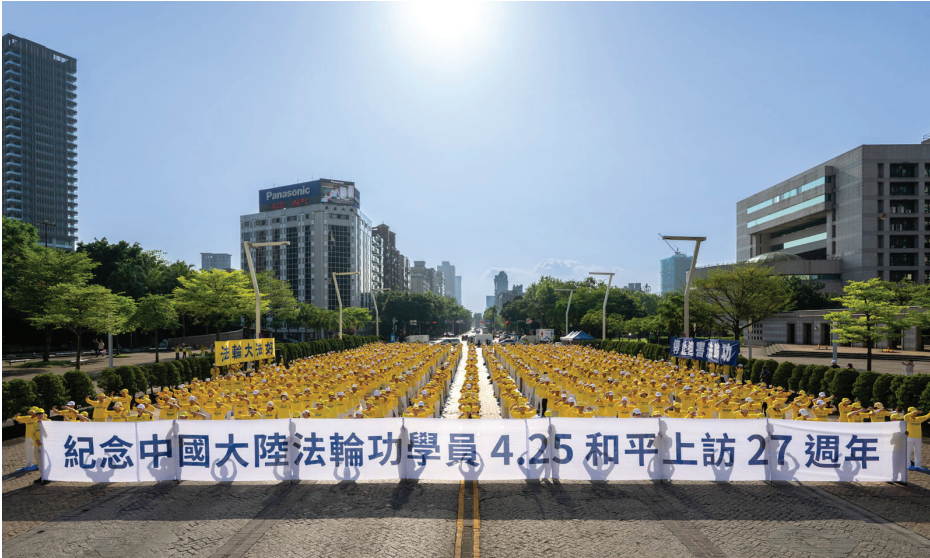
▲ 4月19日, 法轮功学员在台北市府广场前集体炼功。

今年是法轮功学员“4·25 万人大上访”27周年, 世界各地的法轮功学员都在以不同方式, 纪念这个特别的日子。