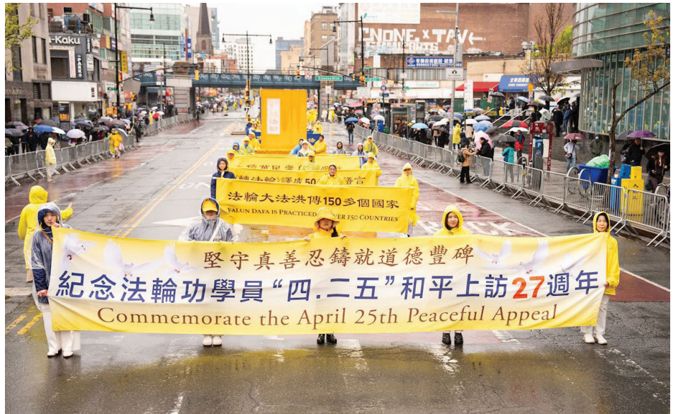
▲ 4月25日，美国纽约法拉盛，法轮功学员举办纪念4·25游行。

据德明州自己介绍，他对法轮功有一个认识过程，从一开始不太了解，到后来听说活摘器官，以及看到身边善良