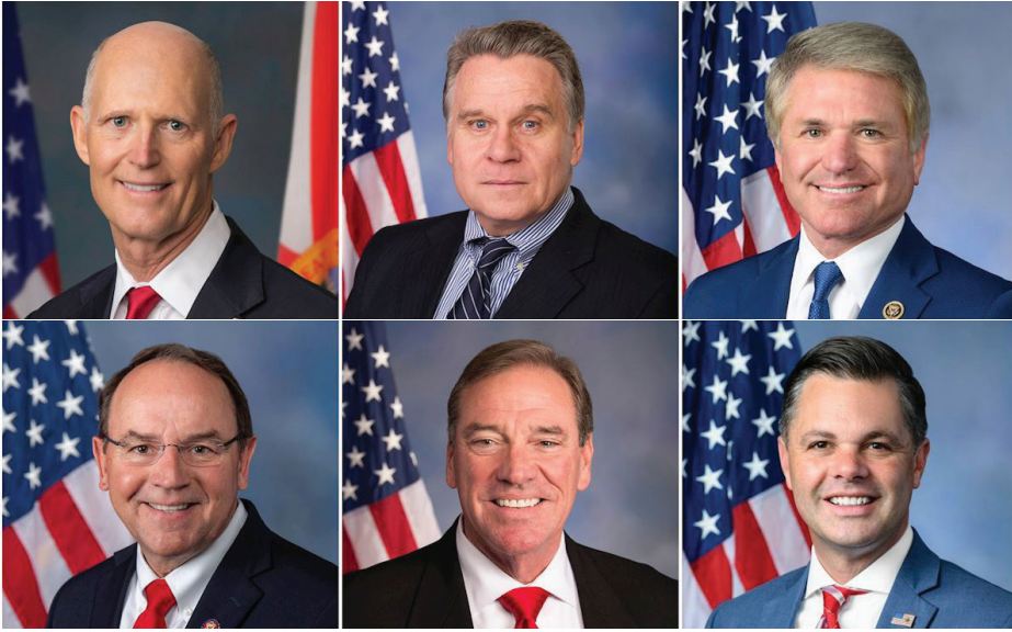
▲ 多位美国国会议员发表声明, 向全球的法轮功学员表达敬意。

【明慧网】2026年4月25日, 正值万名法轮功学员在北京和平上访27周年。美国首都华盛顿部分法轮功学员于4月11日在中国驻美大使馆前集会, 呼吁停止迫害。多位美国联邦参、众议员发表声明支持, 强调将持续推动立法追究中共责任。