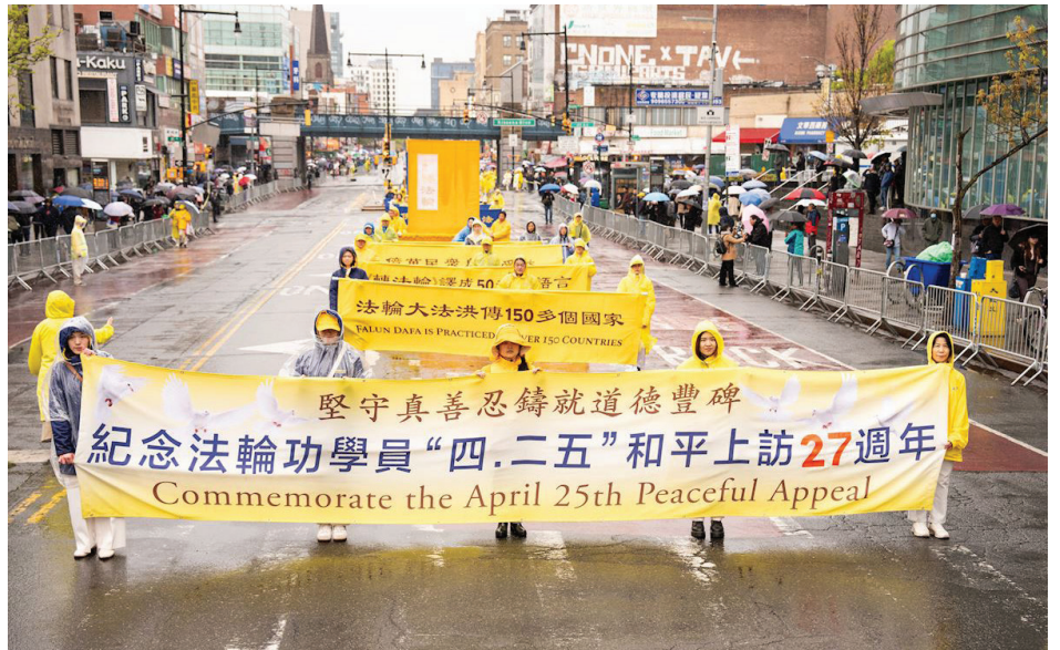
▲ 4月25日，美国纽约法拉盛，法轮功学员举办纪念4·25游行。

据德明州自己介绍，他对法轮功有一个认识过程，从一开始不太了解，到后来听说活摘器官，以及看到身边善良