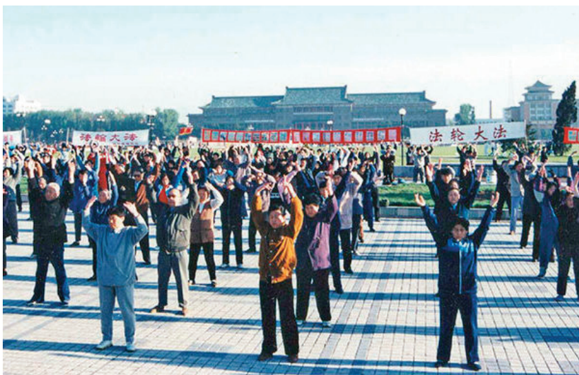
▲ 1998年5月15日，长春文化广场法轮功学员万人炼功。

【明慧网】我的亲家母是一位中医大夫，从医一辈子不知挽救了多少患者，救了多少人的生命，到老了自己的身体却是一团糟，什么病都有。根据她自己从医的经验，她给自己治病，无论怎样对症下药，都是疗效甚微，有的还越来越重。用她自己的话说，我这辈子不知治好了多少个我这样的病人，如今给自己治怎么都治不好了呢。这个，用她的科学头脑怎么也解释不了。