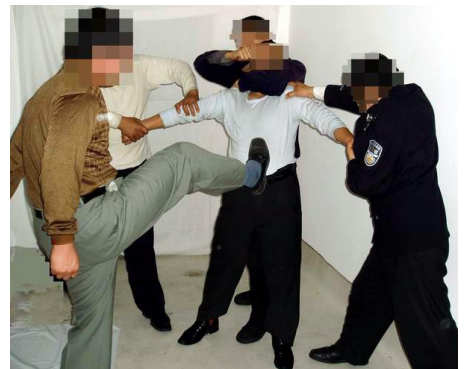
■中共酷刑演示图：毒打

胁，坐小矮凳，不得洗澡，不得购物，不让睡觉等，每天只能躺卧三至四小时。狱警指使包夹犯两人轮流拳打脚踢，致使他身体左腿、左臂肿的不能行走，时间长达半年多，精神与肉体遭受严重摧残。