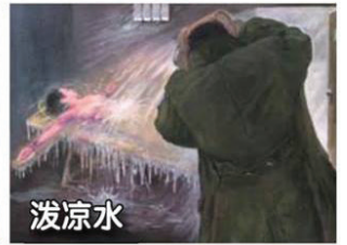
▲ 中共迫害法轮功酷刑迫害示意图

天岗派出所一名绰号“大原儿”的警察用卷成棍状的纸抽打她的头部，逼她承认“发了50多本真相资料”。