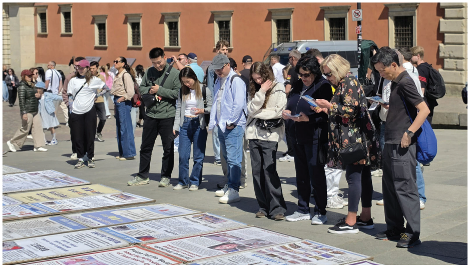
▲路过的数队中国人拍照或阅读法轮功真相资料。

地向她们讲述了“天安门自焚”真相，详细讲解了关于中共诽谤法轮功学员“围攻中南海”的真相，以及中共活摘法轮功学员器官的罪行。当她们明白“三退”保平安的真正意义时，仿佛如梦初醒，都对法轮功学员再三致谢，说：“总算搞清楚了，我们会上网了解更多真相，让家中亲人都远离共产党”。