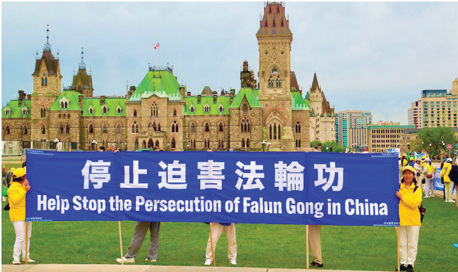
▲ 5月28日, 王毅访加期间, 法轮功团体在国会山等地抗议中共迫害。

【明慧网】2026年5月28日, 中共外交部长王毅抵达加拿大渥太华, 并于次日会见加拿大总理和外交部长。