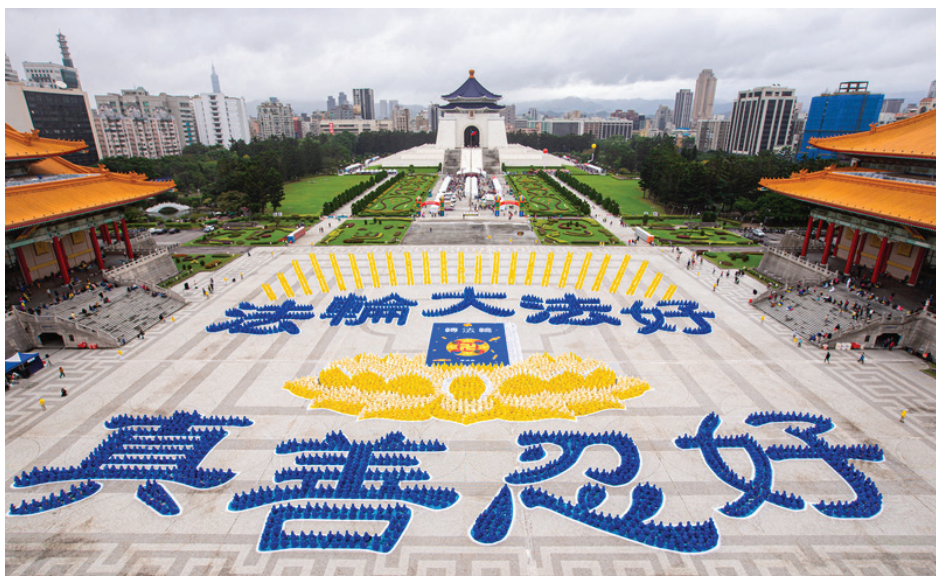
▲ 2020年12月5日，台湾法轮功学员排出“法轮大法好、真善忍好”。

我立即郑重地告诉他：“有办法！只要你相信就有办法，你就诚心默念法轮大法好！真善忍好！就一定会有转机！因为法轮大法是佛法，你信到什么程度，就能好到什么