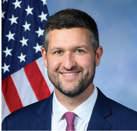
▲ 美国参议员托德·扬（左）和联邦众议员帕特·瑞安（右）。

【明慧网】二零二六年七月四日是美国建国 250 周年纪念日，共和党联邦参议员托德·扬（Todd Young）和民主党联邦众议员帕特·瑞安（Pat Ryan）在发给明慧网的致辞中表示，在庆祝美国建国 250 周年之际，再次承诺保护法轮功学员的信仰自由。